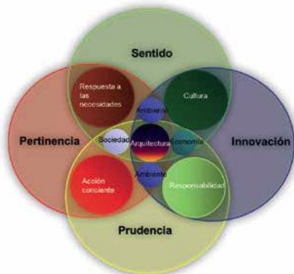
Figura 2. Factores que intervienen en la concepción de una arquitectura más humana y racional.

se rija por los patrones de acontecimientos humanos), esta podría ser más que una sola ciencia dentro de su concepción y posterior construcción (Basado en la complejidad de Morín). Dotada de criterios que le permitan a esta trascender, así como mejorar las condiciones para los usuarios y el medio ambiente, mejorar las sociedades llevándolas a retomar su valor como seres humanos y de concientizarse del ambiente en el que habitan y generando sentido de pertenencia que haga posible llegar a la "cualidad sin nombre" que refiere Alexander.