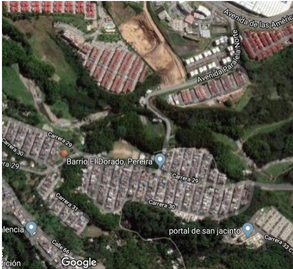
Figura 2. Localización barrio El Dorado

Alrededor del año 1530 los Quimbaya se resistieron fuertemente ante la dominación de los españoles, la cual se prolongó hasta el año 1557. Los indígenas elaboraron una enorme variedad de tumbas diferentes de acuerdo con lo específico de cada entierro, en el que siempre se incluían las ofrendas que habrían de acompañar al difunto en su paso a la otra vida, incluidos víveres y armas para hacérselo más fácil.