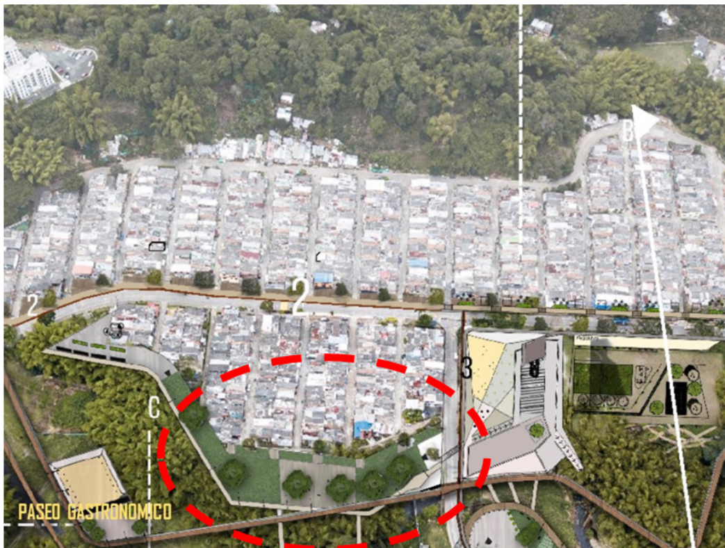
Figura 3. Localización parque Quimbaya