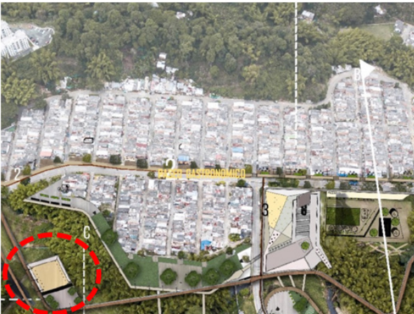
Figura 4. Localización parque del Agua

Es un memorial a las cuarenta personas masacradas en el 2007 en el sector del barrio el dorado.