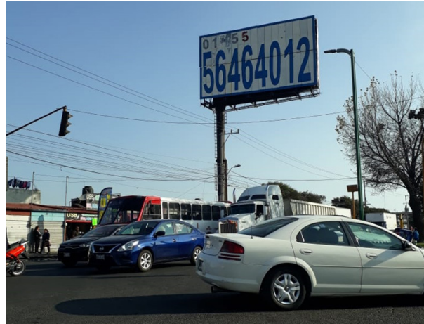
Figura 1. Tráfico vehicular en la ciudad de Toluca.

En éste sentido, una de las consecuencias que se observa es el fuerte nivel de contaminación tanto del sector industrial -el cual no tiene una correcta gestión de residuos y consumo energético-, así como por parte de la población donde se aprecia un desmedido descontrol y falta de educación para el cuidado del medio ambiente. Por otra parte se observa la creciente cantidad de vehículos que transitan diariamente en las metrópolis contribuyendo con dicha contaminación. Asimismo la explotación de recursos de las regiones e incluso, el casi agotamiento de ellos, advierte la casi inevitable situación que en un futuro cercano espera a la sociedad, ya que no hay regeneración de ellos y se han generado presiones al planeta más de lo que puede proveer sin considerar que el sustento para la población se está agotando paulatinamente.