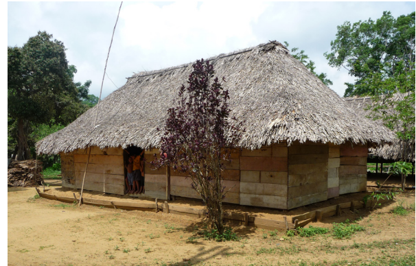
Figura 3. Casa Colosó, Sucre.

las fuerzas contenidas en esa transición. Cultura es el producto de la vieja clase aristocrática que ahora busca defenderla del ataque de fuerzas nuevas y destructivas. Cultura es la herencia de la nueva clase en ascenso que contiene la humanidad del futuro y que busca liberarla de sus restricciones (Williams, 1990, p. 28).