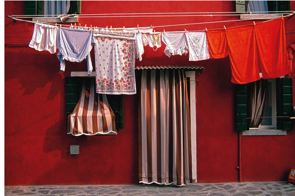
Figura 2. Casa Burano, Italia.

ha sido el refugio privado donde el individuo puede florecer. Juntos, el asentamiento el espacio urbano, la institución y la casa, constituyen un entorno total. Este entorno, sin embargo, siempre se ha relacionado con algo dado, con un paisaje que posee cualidades generales y particulares. Habitar, entonces, significa también hacer amistad con un espacio natural (Norberg Schulz, 1985, p.7)