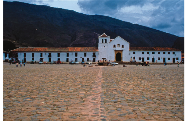
Figura 1. Plaza Villa de Leyva, Boyacá, Colombia.

“El verbo ‘habitar’ significa aquí algo más que tener un techo sobre la cabeza y un cierto número de metros cuadrados disponibles. Significa primero el encuentro con otros para el intercambio de productos, ideas y sentimientos, esto es, el experimentar la vida como una multitud de posibilidades. En segundo lugar, significa llegar a un acuerdo con otros, esto es, aceptar un conjunto de valores comunes. Finalmente, significa ser uno mismo, en el sentido de tener un pequeño mundo escogido como propio. Podemos denominar esos como los modos colectivo, público y privado de habitar. (Norberg Schulz, 1985, p. 12).