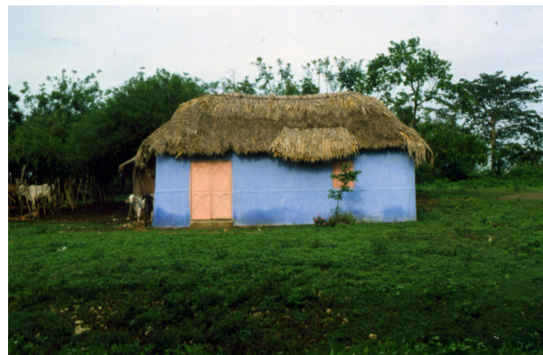
Figura 4. Casa campesina Lórica, Córdoba.

Estos documentos permiten captar características interesantes de los modos de habitar de este grupo indígena, con un nivel avanzado de organización territorial y de construcción de los asentamientos y de las viviendas. La cronología de estos asentamientos se sitúa entre los siglos I y VII de la era actual, lo que coincide con la datación de otros asentamientos prehispánicos en el territorio colombiano, por ejemplo la del período clásico de San Agustín.