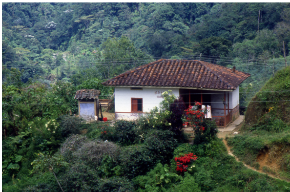
Figura 5. Casa cafetera, Quindío.

Holton llegó en un navío al puerto de Sabanilla, cerca de Barranquilla, el 21 de agosto de 1852. Tomó la ruta del Magdalena hacia el interior del país, se detuvo en Mompós, como era de rigor en ese momento, continuó la travesía fluvial hasta llegar a Honda y desde allí emprendió el ascenso a la sabana de Bogotá por la ruta de Guaduas. Al igual que sus antecesores, hizo la visita religiosamente programada al Santo de Tequendama. Se interesó por las regiones de Choachí y Ubaque y de Fusagasugá y Pandi. Desde esta última viajó a Ibagué y sus alrededores. Nuevamente desde Bogotá inició otro recorrido hacia el valle del Cauca pasando por Ibagué y el paso del Quindío. En el Valle visitó Cartago, Buga, Palmira, Cali y varias haciendas y poblaciones cercanas. En el libro no hay registro del viaje de regreso a los Estados Unidos.