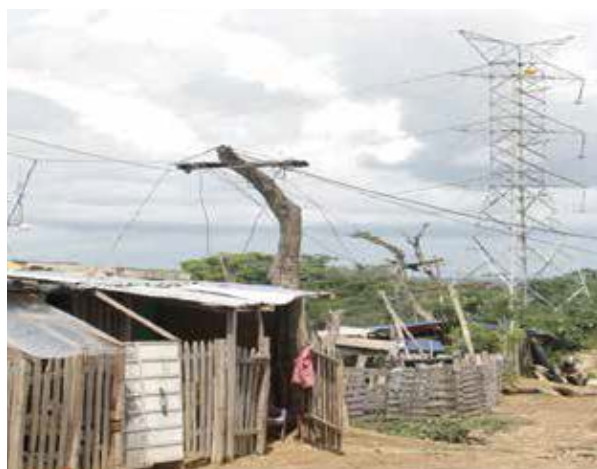
Figura 3. Imagen sector Los Olivos.

El Sector los Olivos es el más pequeño de los sectores, está conformado aproximadamente por 100 casas.