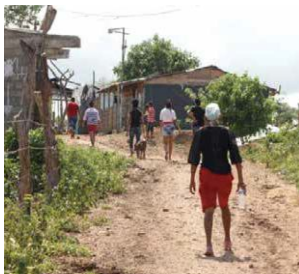
Figura 2. Imagen sector Luz Verde.

El Sector Luz Verde está dentro de ese subgrupo de sectores que conforman el barrio cerros de albornoz, el cual hace parte de la Localidad 3 (Industrial de la Bahía) de la ciudad de Cartagena.