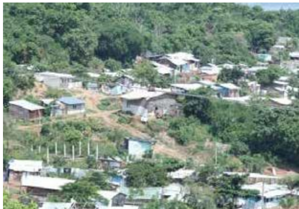
Figura 6. Panorámica Cerro de Albornoz. Fuente Estudio Cerro de Albornoz (Corvivienda, 2016)

Finalmente el Sector Girasoles de Bettel, cuyo nombre obedeció a que anteriormente se podían observar muchos girasoles en la zona, por lo cual se hizo honor al nombrar el sector.