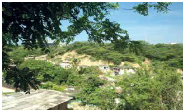
Figura 3. Taludes verticales con evidencia de proceso deterioro de suelo. Fuente: Estudio Cerro de Albornoz (Corvivienda, 2016).

El asentamiento del Sector La Paz del Barrio Cerros de Albornoz, está ubicado en la Localidad 3 o Industrial de la Bahía, suroccidente de Cartagena al igual que los antes citados, fue invadido como los otros sectores hace aproximadamente 7 años. La ubicación del sector el general está en una zona de alto riesgo, la mayor parte de las viviendas están habitadas con condiciones no adecuadas que alteran la calidad de vida de quienes las habitan.