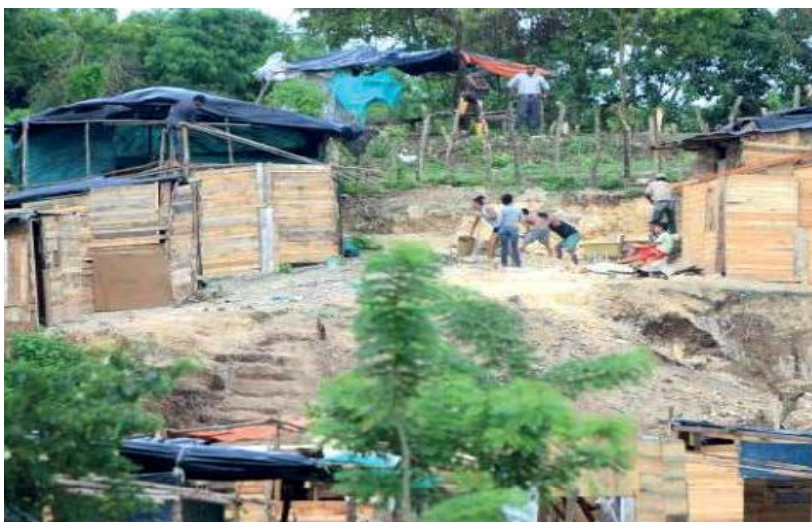
Figura 4. Sector Mirador de Cartagena.

A pesar de todas las problemáticas, de este sector se rescata la dedicación en el cultivo de diferentes víveres y frutas encontradas en el sector, lo cual hace que en ese aspecto, los habitantes sean productivos.