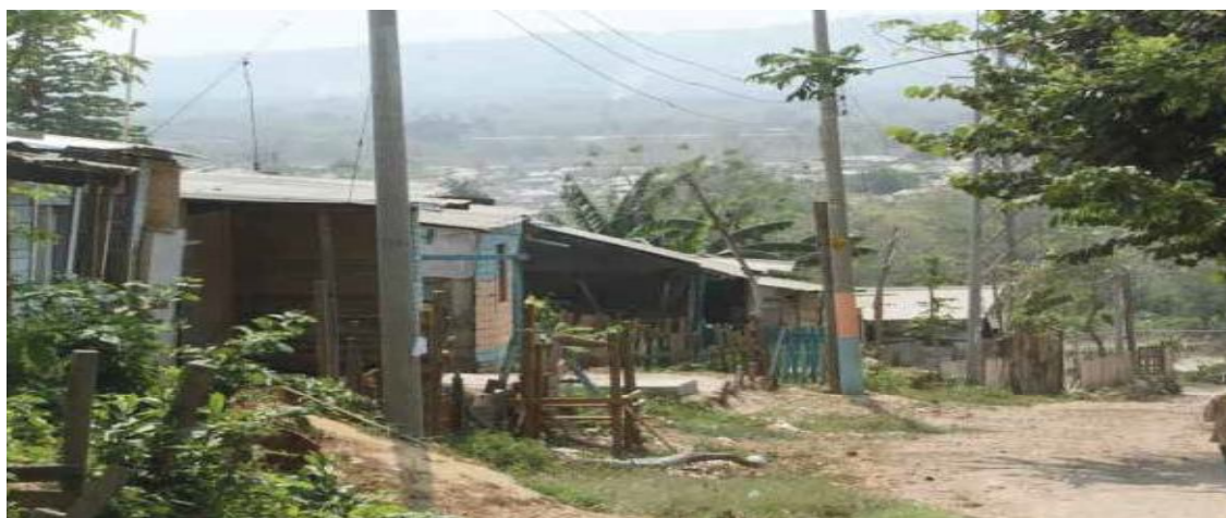
Figura 5. Sector Los Girasoles de Bettel.

Se evidencia la presencia de un muro de contención para evitar los daños ocasionados por deslizamientos de tierra en épocas de invierno.