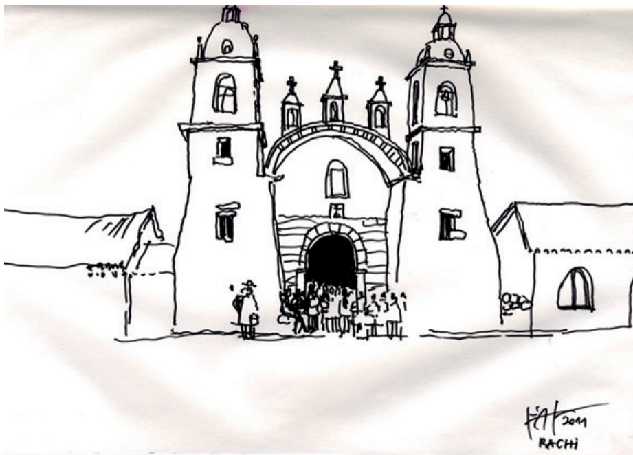
Figura 02 Perspectiva, Cuzco, 2011 (Imagen del autor).

Sin embargo en los diferentes sitios (lugares) la evolución urbana, se dio a diferente velocidad y esa realidad se refleja en la organización, concentración, y densidad, en donde el factor tiempo, reúne en varios puntos de encuentro a la población, al territorio, la geografía y los intereses políticos, unidos