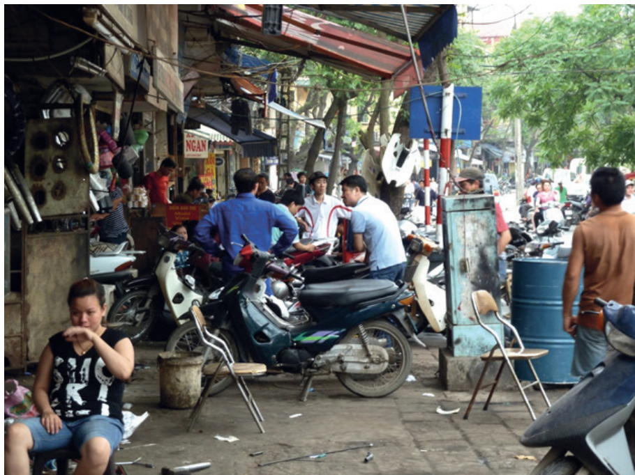
Figura 11 Ocupación de la calle. Vietnam, 2011

una nueva y diferente manera de pensar el diseño de la planificación urbana, una nueva y urgente respuesta única en la historia de la evolución urbana de las mega ciudades, que nacerán en un futuro muy cercano.