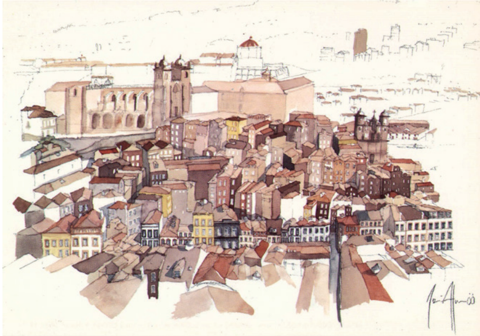
Figura 12 Acuarela, Oporto, Portugal, 1988

identificación del individuo con el espacio público, que debe ser diseñado a la medida de las necesidades de sus usuarios.