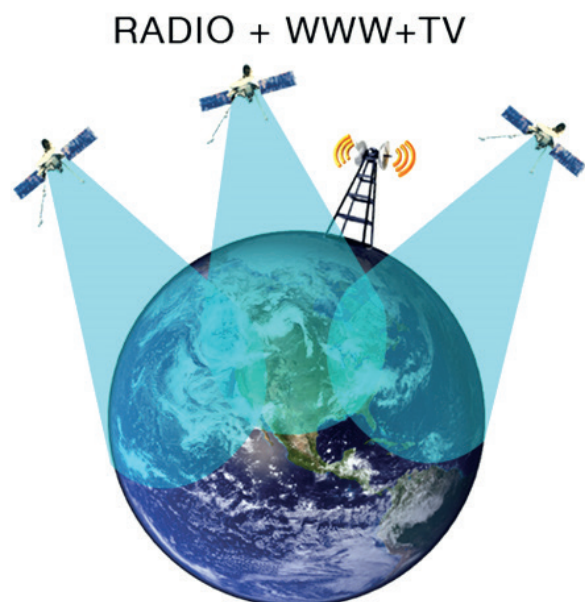
Figura 10 Ciudad digital, 2011

Los suburbios de los años 60 y 70 no tienen ya las características de lo que se puede considerar la ciudad tradicional, esto debido al permanente desarrollo económico, además de la influencia y clara interpretación de las teorías urbanísticas modernas, lo que nos lleva a un nuevo caso