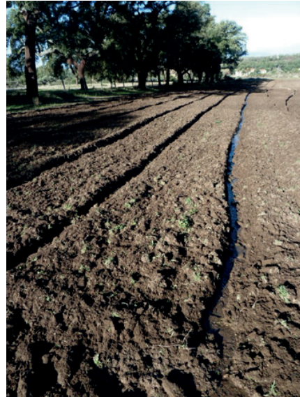
Figura 04 Espacio rural, 2012.

espacios ocultando sus rituales e intentando mantener sus formas de vida, no es menos cierto que el espacio público que les era exclusivo dejó de estar separado del resto...".