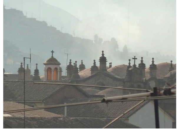
Figura 09 Detalle de los tejados, Cuzco, 2011