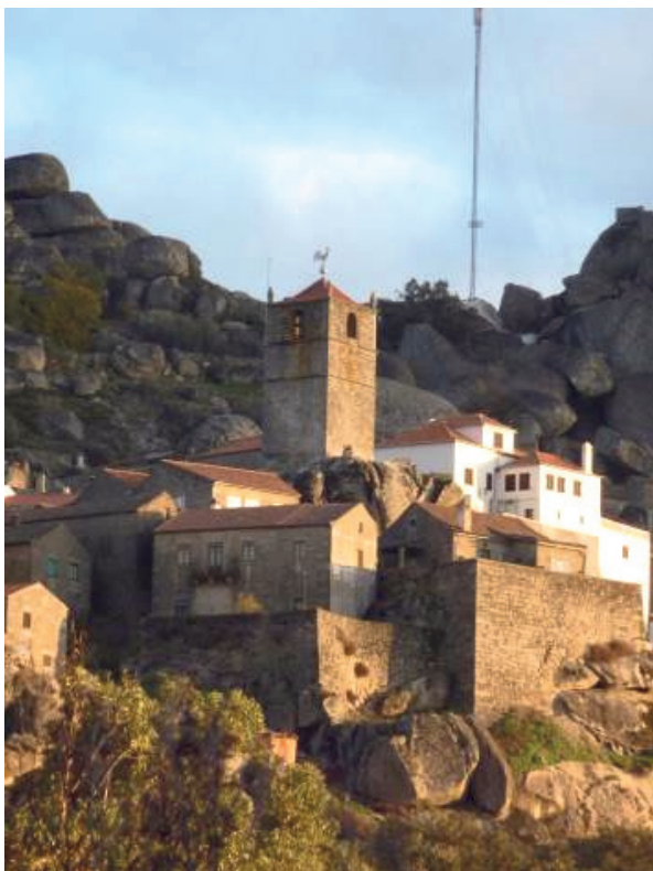
Figura 07 Villa de Monsanto, Portugal, 2013

La gran diferencia entre el desarrollo de las ciudades de influencia portuguesa y española, y las ciudades anglo-sajonas adviene de su vivencia y de su cultura, de la ocupación del suelo urbano. Por un lado la ciudad más emotiva, más compleja, aparentemente más caótica, tal vez con influencia mediterránea, tiene su arquetipo en la ciudad griega y en la ciudad romana,