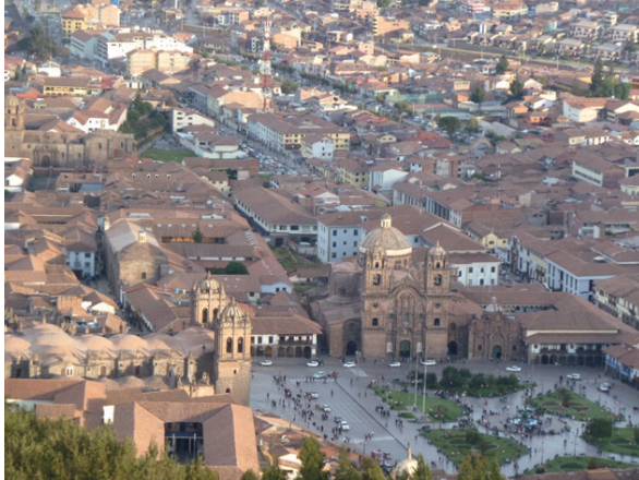
Figura 08 Vista de conjunto, Cuzco