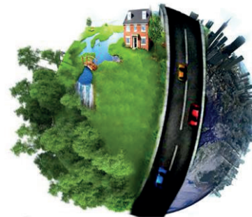
Figura 06 Esquema naturaleza + rural + ciudad, 2013. (Imagen del autor)

NATURAL RURAL CIDADE NATURE COUNTRY CITY