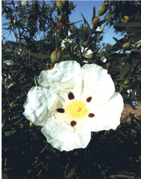
Figura 03 Naturaleza, 2011 (Imagen del autor)

directamente relacionado con las profundas mutaciones estructurales de la sociedad, identificables con la contra-reforma, está el final formal de los guetos étnicos; en efecto, juderías y morarías han dejado forzosamente de existir, y si en realidad esas comunidades han permanecido en sus