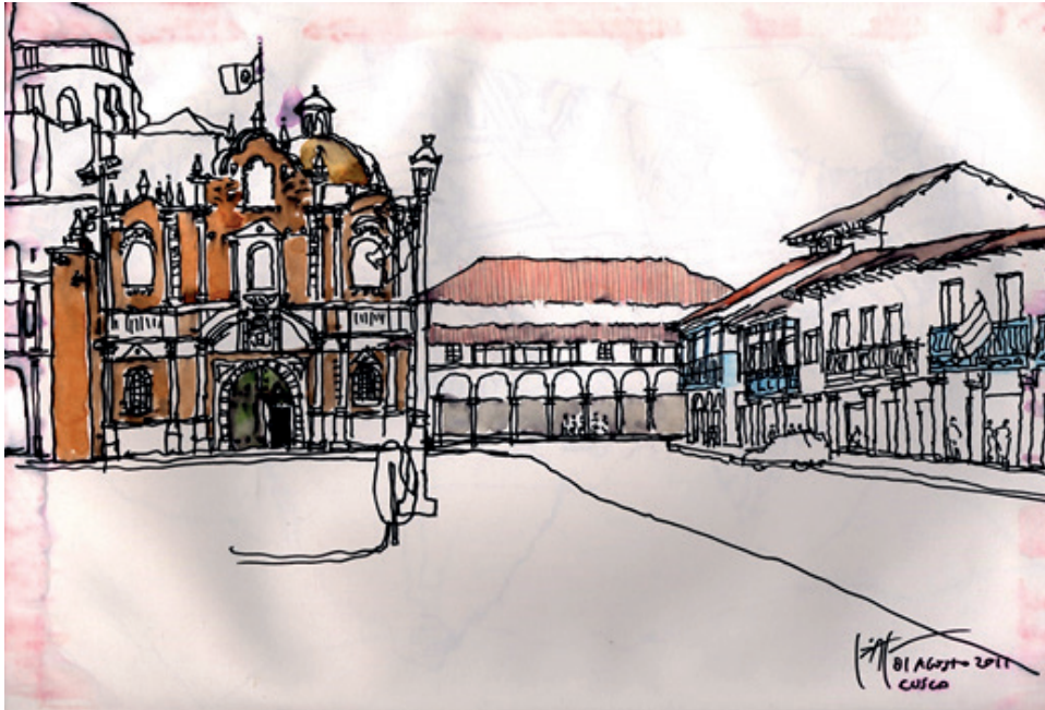
Figura 01 Acuarela. Cuzco, Perú, 2011 (Imagen del autor)